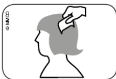
Abb. Durchkämmen des nassen Haares mit Läusekamm vom Haaransatz bis zu den Haarspitzen